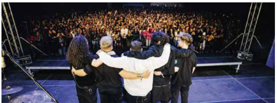
Több ezer fiatal tombolt Azahriah koncertjén