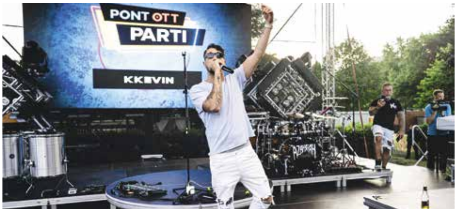
KKevin a Pont Ott Partira is szókimondó dalokkal érkezett