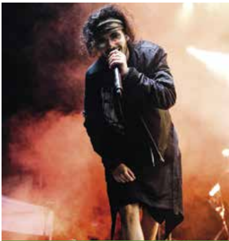
Azahriah napjaink egyik legnépszerűbb magyar előadója