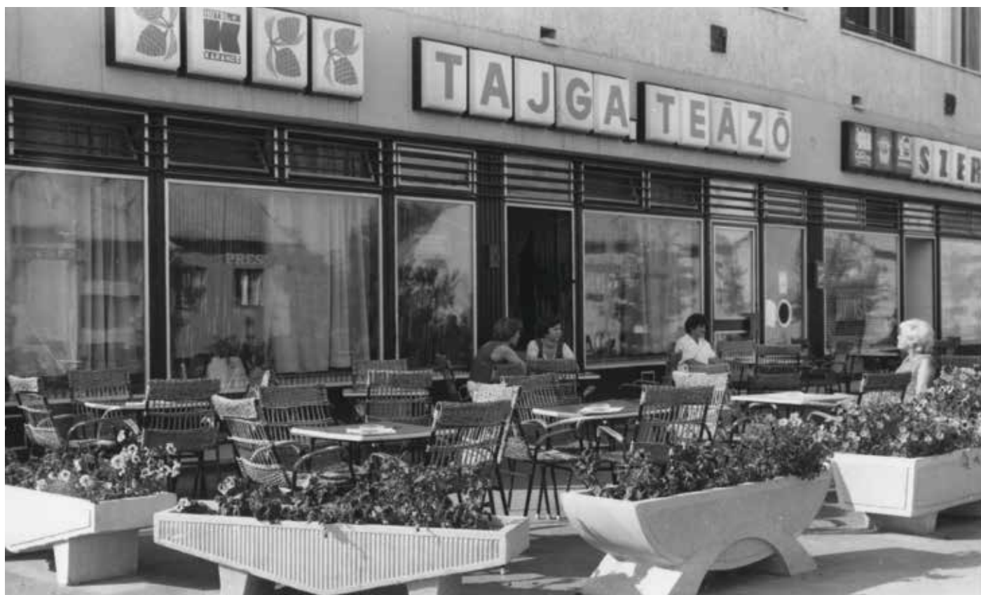
Az 1976-tól működő Tajga Teázó a Kemerovo-lakótelepen, 1970-es évek vége.

Időközben a képviselők arról is döntöttek, hogy nem kérik Salgótarján számára a megyei jogú városi címet.