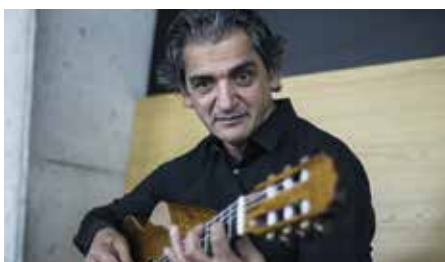
Snétberger Ferenc gitárművész „hazai pályán” is csodát művelt

A fesztivált időközben nagyobb szabású attrakcióvá bővítették, amikor a háromnapos rendezvényt más műfajú kulturális