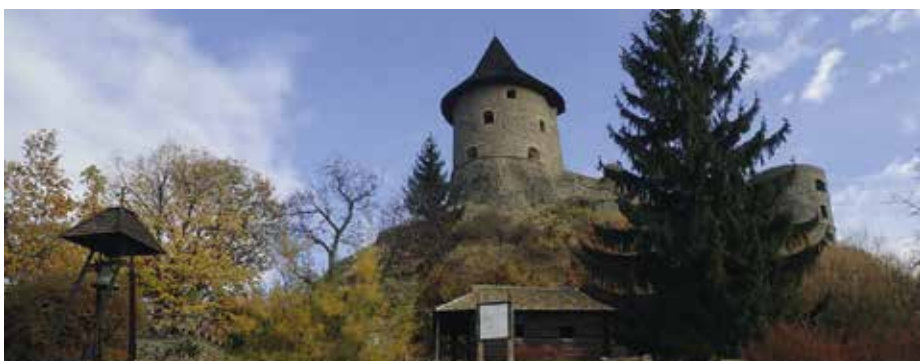
A somoskői vár

Somoskőújfalu neve 1455-ben bukkan először elő az írásos forrásokban. Ekkor Somoskő várának tartozéka Ujfalu néven jelenik meg, és Szécsényi László birtokához tartozik. 1461-ben a Losonczy és az Ország családok