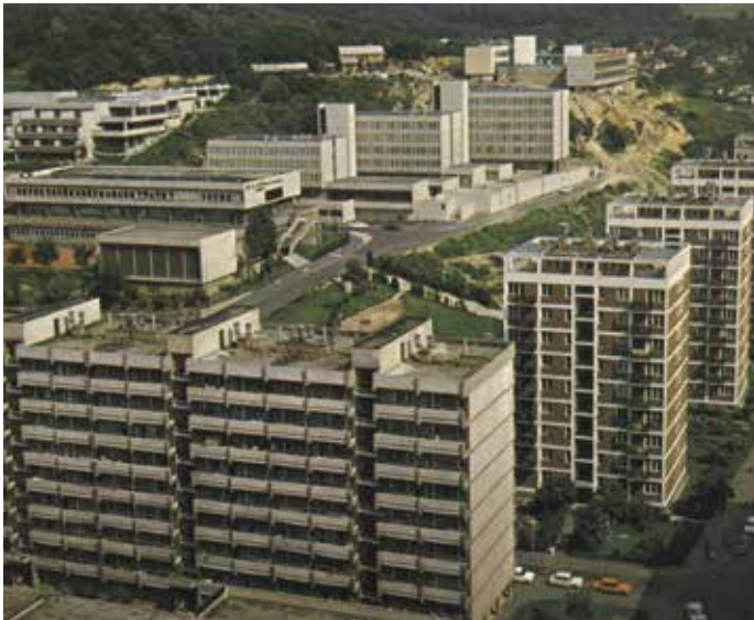
Légi felvétel a Pécskődomb környékéről, 1980 körül. A Pécskődombra épített oktatási intézmények: MSZMP megyei oktatási központja, a Bolyai János Gimnázium, a leánykollégium, a Számviteli Főiskola.