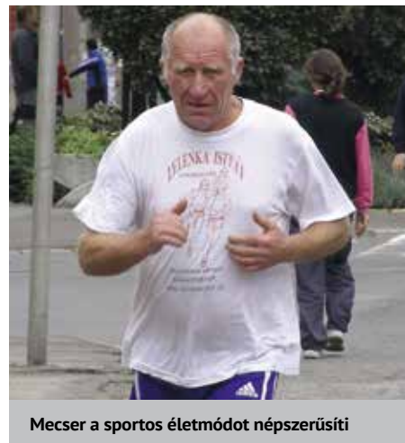
Mecser a sportos életmódot népszerűsíti