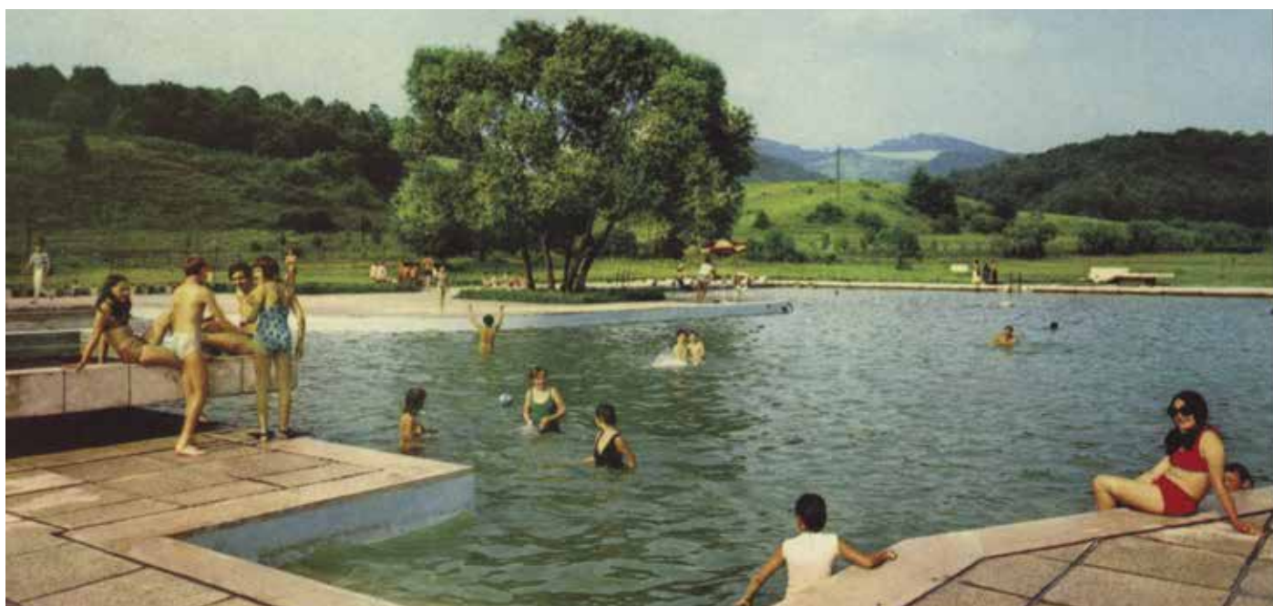
A Tóstrand első épített medencéje, 1970-es évek

1999-től a Somosi Kultúráért Egyesület és a Somoskői Váralja Egyesület indítványára 1924. február 15-ét a „hazatérés napjává” nyilvánították.