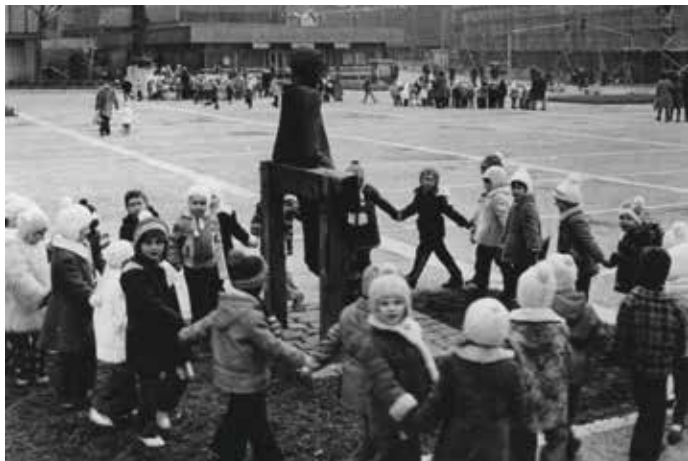
Óvodások a Radnóti-szobor körül, 1970-as évek második fele

Az emlékév 12 hónapjában lapszámaink mellékletében fotókkal, emlékezésekkel, anekdotákkal elevenítjük fel Salgótarján 100 évének történéseit.