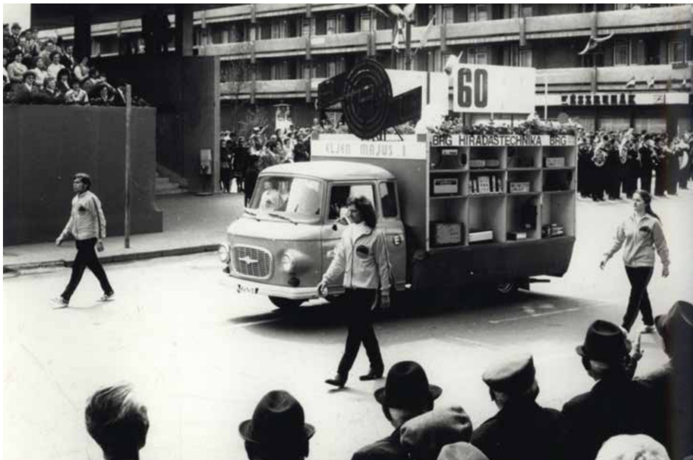
A BRG (Budapesti Rádiótechnikai Gépgyár) salgótarjáni üzemének felvonuló kocsija május 1-én, 1977