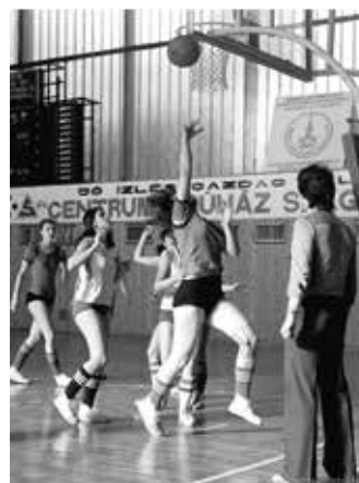
SBTC női kosárlabda mérkőzés az 1979-es Karancs Kupán