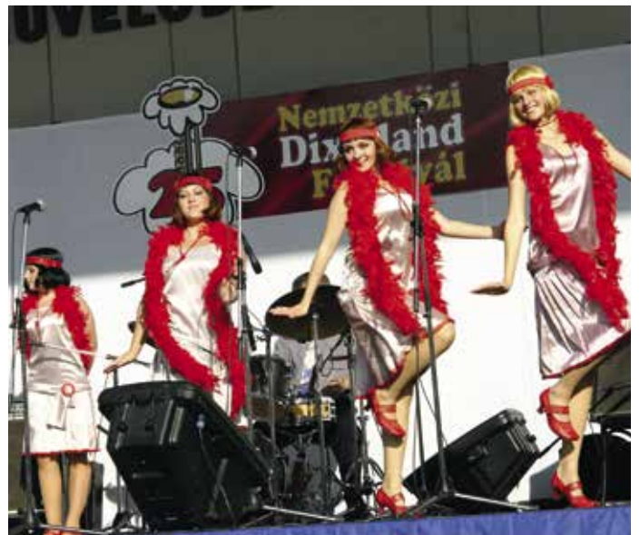
A 25. Nemzetközi Dixieland Fesztivál, 2009