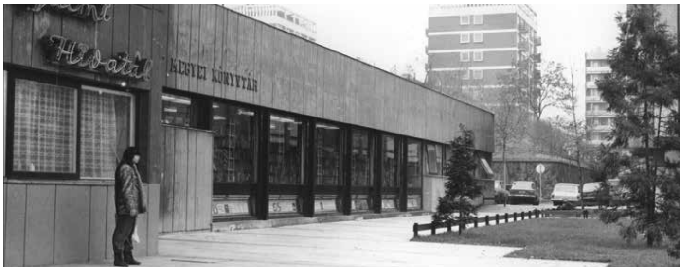
A megyei könyvtár a József Attila Művelődési Otthon déli szárnyában működött 1966-1988 között

– Azt, hogy a munka az alapja mindennek! – vágja rá. – Munka nélkül nincs teljesítmény!