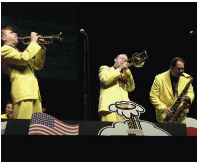
A 25. Nemzetközi Dixieland Fesztivál, 2009. A fesztivált 1984-ben rendezték meg először, 1985 és 2020 kivételével minden évben megtartották.