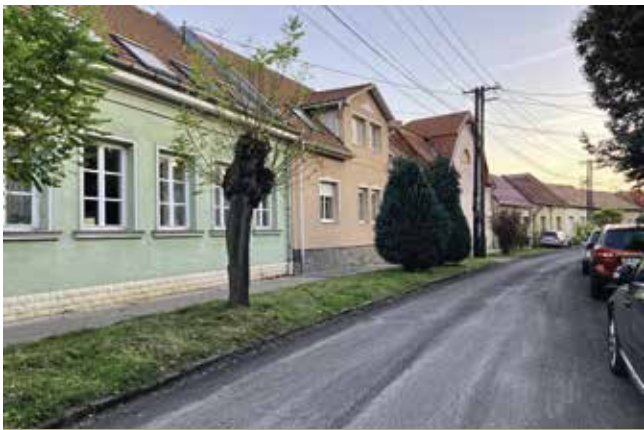
Új ruhát öltött a Május 1. út

Mint arról egy korábbi lapszámban már beszámoltunk, az önkormányzat több út- és járda felújítást tervezett az ősze, melyek közül volt, ami már szeptemberben elkészült, többnek a kivitelezése pedig az elmúlt hetekben zajlott.