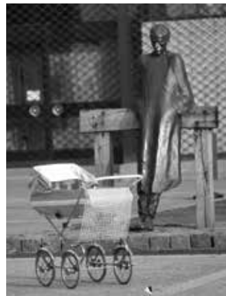
Varga Imre 1970-ben átadott Radnóti Miklós szobra a főtéren, 1978