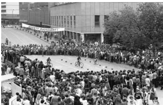
A Petőfi Rádió Ötödik sebesség című műsorának adása Salgótarjánból, 1980