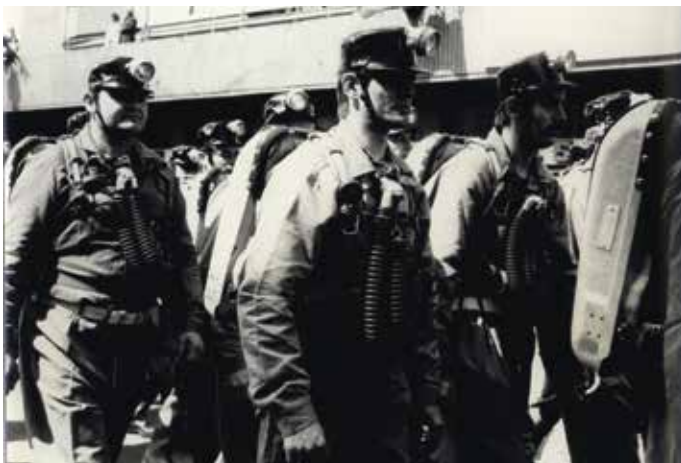
Felvonuló bányamentők május 1-én, 1980 körül