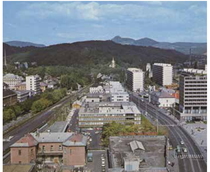
A városközpont 1982-ben. Balra lenn még az 1914-ben emelt postaépület látható.