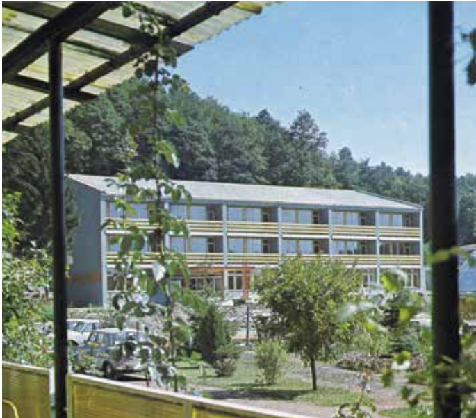
KISZ tábor Salgóbanya mellett, a későbbi Hotel Medves, 1980-as évek eleje