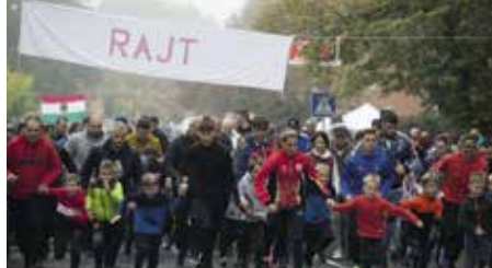
Rajtol az '56-os emlékfutás mezőnye