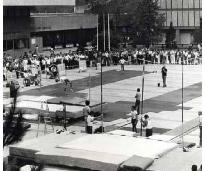
Az első, 1986-ban megrendezett ugrógála a főtéren. A versenyt 1986-1998 között a város főtéren, majd 1999-2010-között Somoskőn rendezték meg.