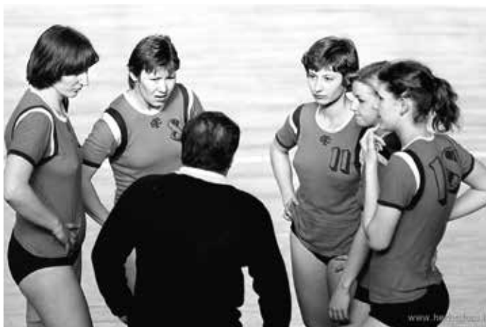
Az SBTC női kosárlabda csapatának tagjai az 1979-es Karancs Kupán