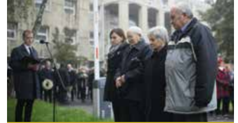
A POFOSZ Nógrád Megyei Szervezetének képviselői is fejet hajtottak a hősök emléke előtt

A megyeháza előtt, az 1956-os forradalom és szabadságharc Nógrád megyei mártírjainak emlékére állított emléktáblánál hajtottak fejet a hősök előtt október 23-án Salgótarjában.